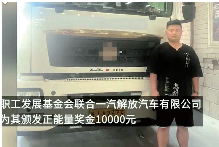
职工发展基金会联合一汽解放汽车有限公司 为其颁发正能量奖金10000元

灾难无情人有情，每次危急关头中总有英雄挺身而出，还会涌现出英雄群体。今年2月22日凌晨，广州南沙沥心沙大桥，因被过往船