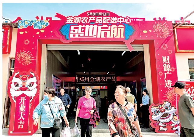
金湖农产品配送中心

本报讯(记者 李爱琴 文图)“牛肉才20元多一斤,真便宜,今天多买点”“家门口终于有了菜市场,以后买菜方便了。”5月9日,金湖农产品配送中心正式开业,吸引周边市民纷纷前来采购。