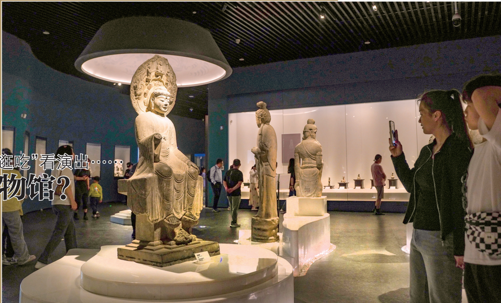
观众在河南博物院观看“山西两周精品文物展”