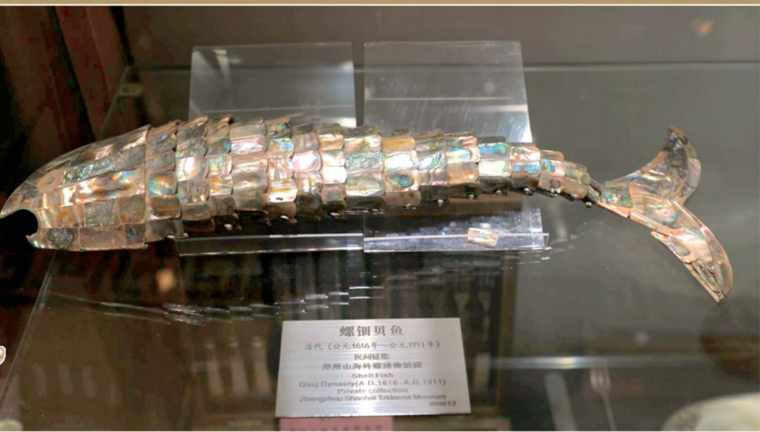
砗磲博物馆展出的文物