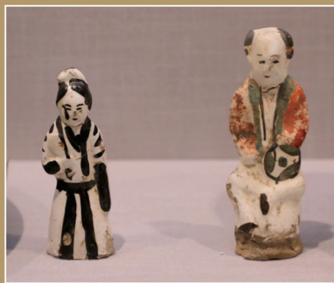
南水北调博物馆展出的女俑

“现在博物馆越来越‘热’了,进门排队、提前预约成为常态”“过去可能一年去不了几次博物馆,现在是经常往博物馆里跑”……又是一年“5·18国际博物馆日”,关于博物馆的话题更加引人注目。无论节假日还是周末,越来越多的人愿意走进博物馆,在历史与文化的熏陶中,享受闲暇时光乐趣。对博物馆的兴趣更浓、去博物馆的人数更多,成为不争的事实与可喜的现象。为什么大家越来越喜欢去博物馆?记者连日来采访了多家博物馆寻找答案。