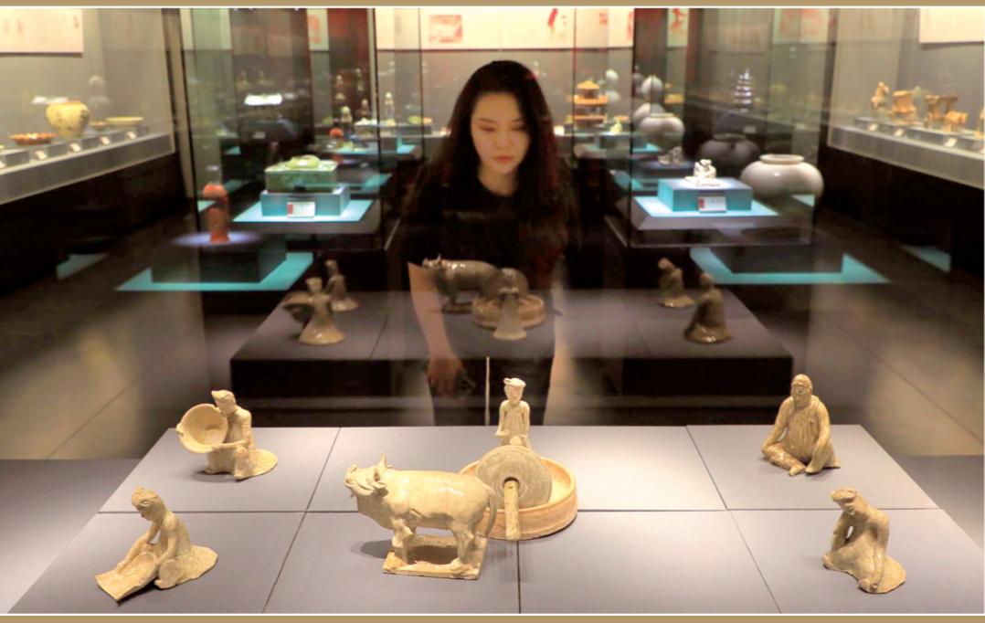
观众在大象博物馆看展