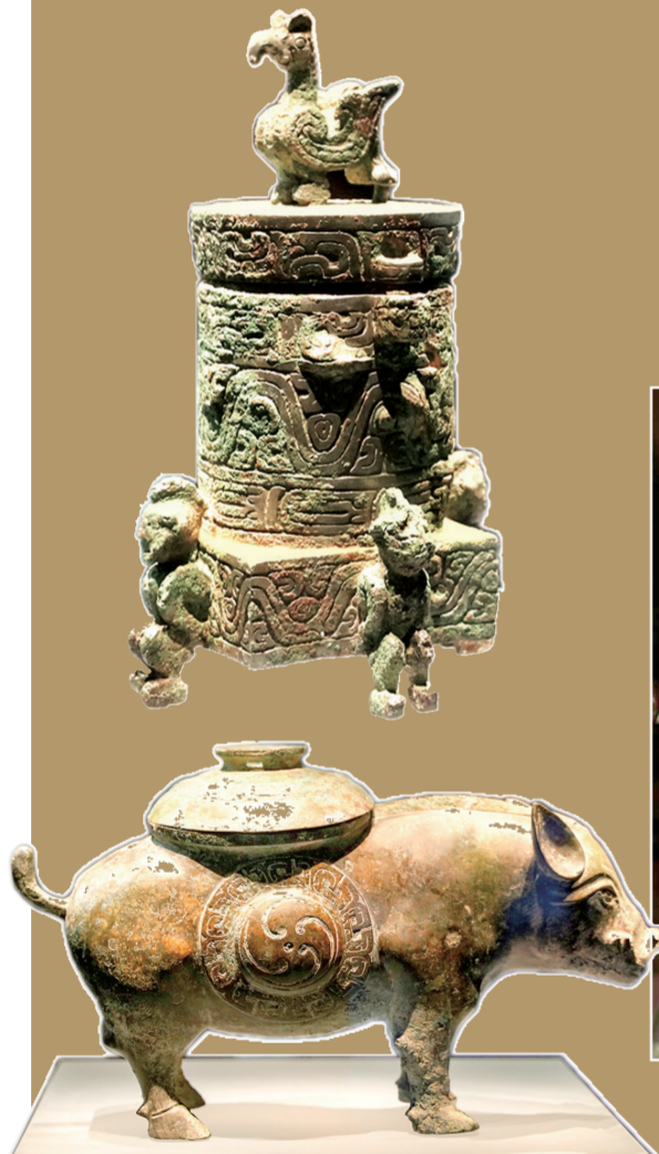
“晋国雄风——山西两周精品文物展”展品

今年国际博物馆日来临之际,各大博物馆准备的多样活动也十分“好玩”:郑州二七纪念馆推出植物拓染把春天“袋”回家活动,郑州大象陶瓷博物馆邀请黄河路二小的学生们通过皮影戏、舞蹈等多种形式展示郑州大象陶瓷博物馆馆藏文物背后故事……内容不重样、体验参与强、常去常新的活动设计,成为观众走进博物馆的“吸铁石”。