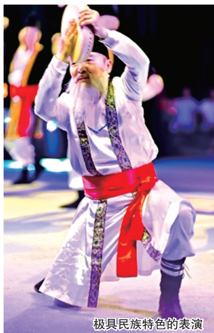
极具民族特色的表演

“友邻有爱 美好金水”，初夏时光，人们走出家门，从四面八方聚在文博广场，尽情地欣赏精彩的节目、品尝可口的美食、享受贴心的服务，为期四天的2024郑州邻居节洋溢着欢乐的氛围。我们撷取部分镜头，定格欢乐的瞬间。