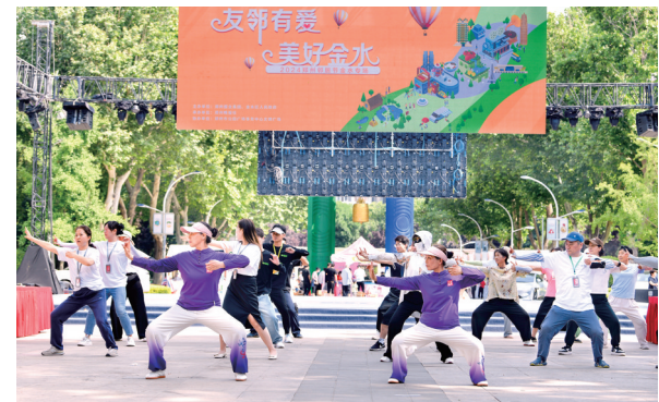
邻居们在一起练八段锦

在内容、形式上不断发展创新的邻居节，拉近了邻里之间心与心的距离，传递着邻里的温暖情谊，弘扬着守望相助的传统美德；邻居节，这座重塑亲邻文化、构架政民关系、促进社会和谐“连心桥”，让与邻为善的氛围，涵养出文明新高度，让大家的小日子拥有细水长流的幸福，也让城市拥有了更温暖的胸怀。