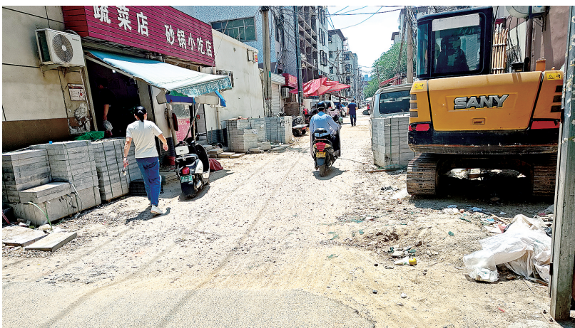
司家庄中街待修路段

本报讯(记者 汪永森 文/图)“只差三五十米,司家庄中街就连上顺河路,现在施工一停就是俩仨月,夏季下雨这段肯定要积水,希望尽快把路铺好,方便大家出行。”近日,高女士向本报反映,司家庄片区城市更新项目中的司家庄中街北段停工,剩余一段小路未能和北端的顺河路连接,希望相关部门督促尽快恢复施工。