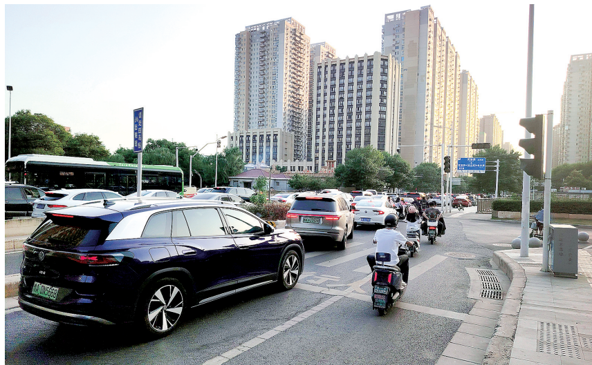
福元路建业路口车流量大

随后,记者将该路口的情况向郑州市公安局公安交通管理局进行了反映,工作人员表示将会安排专人前往现场实地调研。