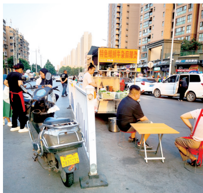
餐饮摊位摆到路上