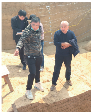
嘉宾在考古工地参观