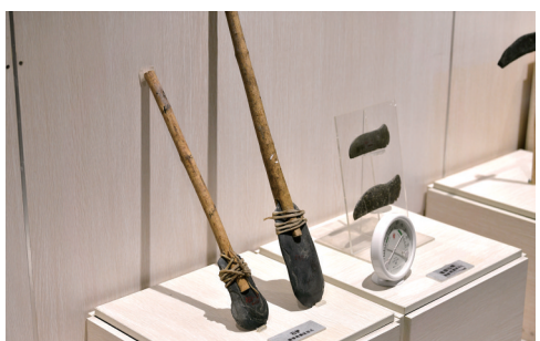
裴李岗遗址出土的石铲