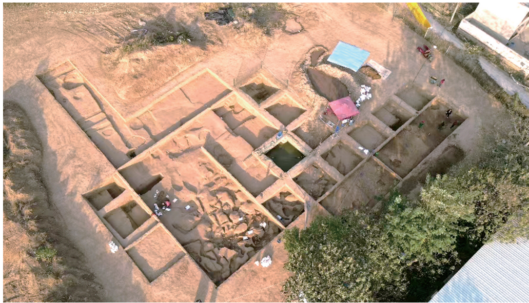
2021年3月22日裴李岗遗址现场