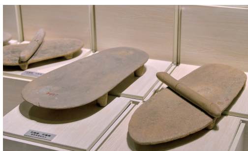
裴李岗遗址出土的石磨盘、石磨棒