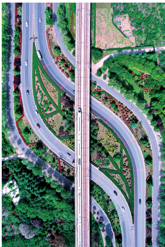
俯瞰中原西路与郑西客运专线交会处