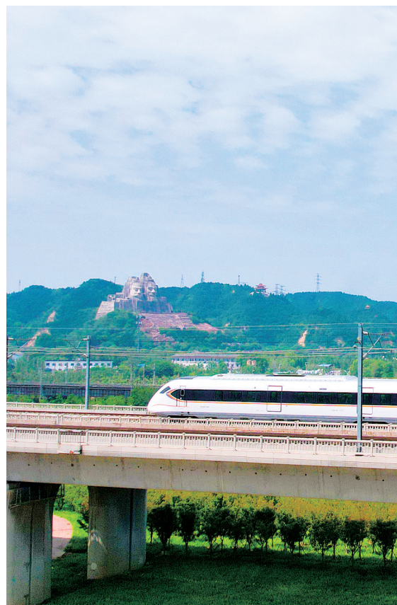
京广线与郑太高速铁路都途经黄河文化公园