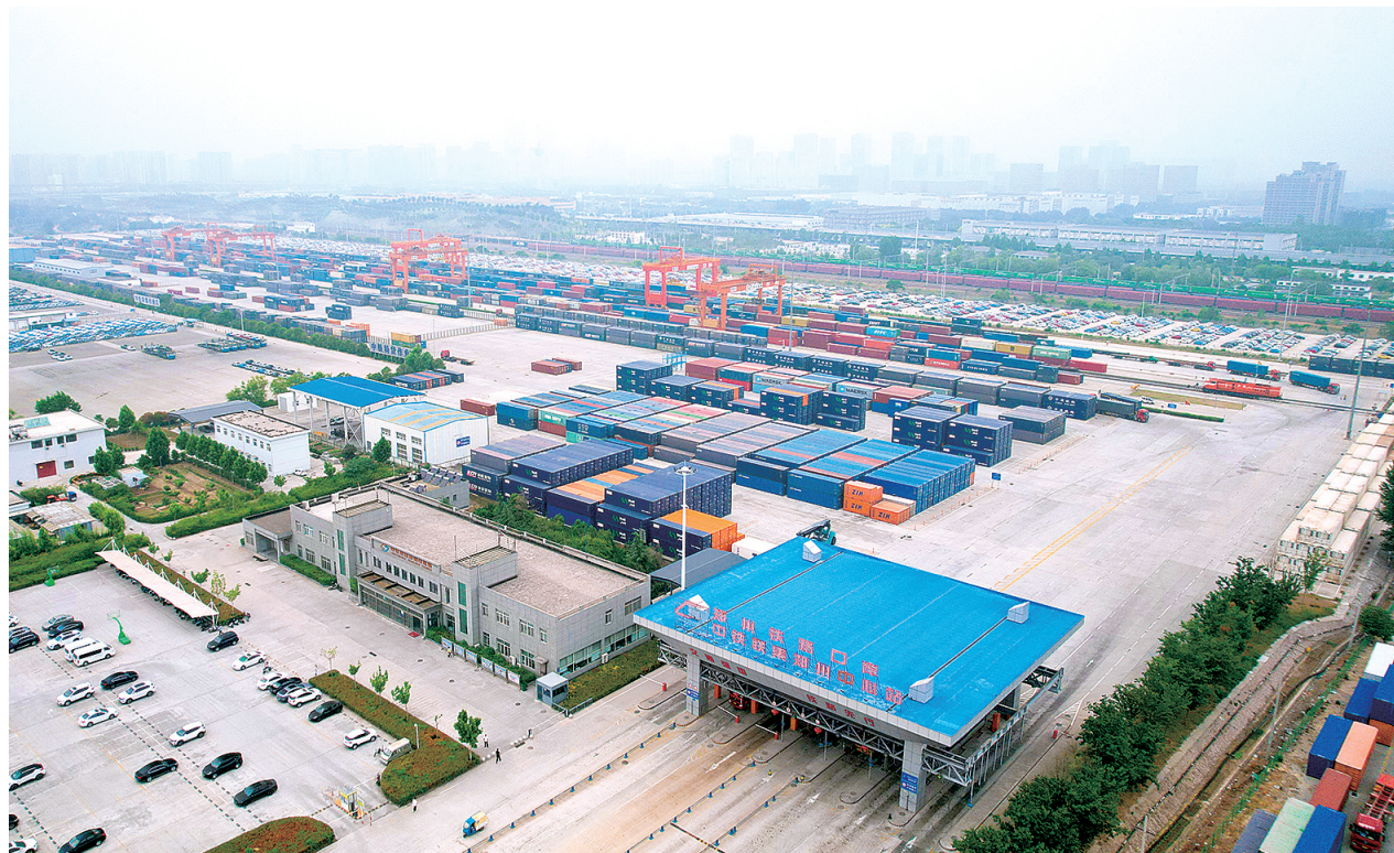
郑州铁路口岸，中欧班列在这里驶向世界