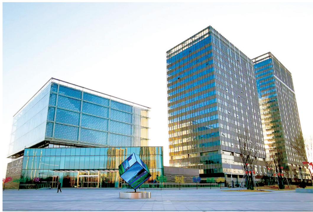
郑州(国家)高新区智慧城市实验场

郑州高新区迅速行动,抢先布局,在算力基础设施建设方面,已建成国家超级计算郑州中心以及联通、移动、电信三大数据中心,为算力网建设提供了强有力的支撑;集聚了一批电子信息产业企业,具有较好的产