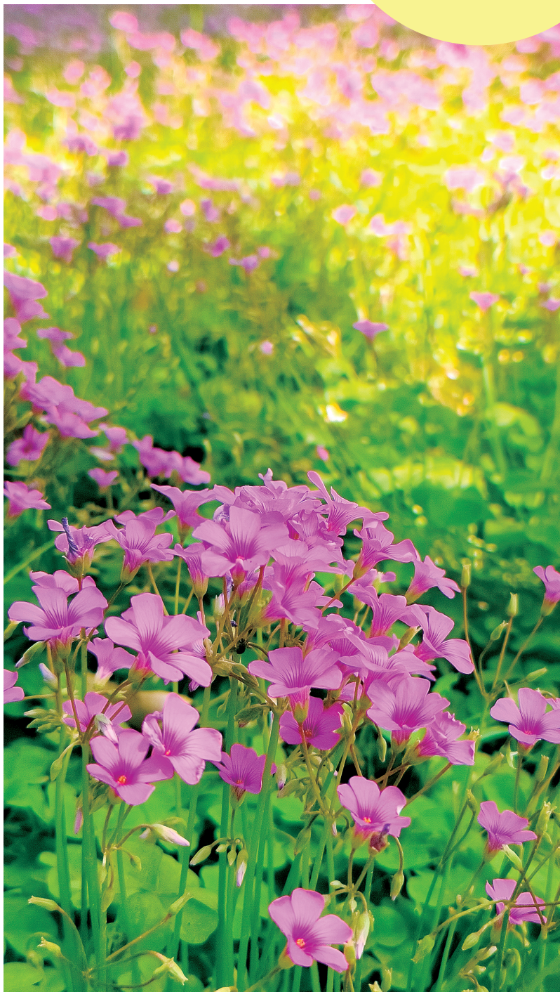
二七区叠彩园花开绚烂