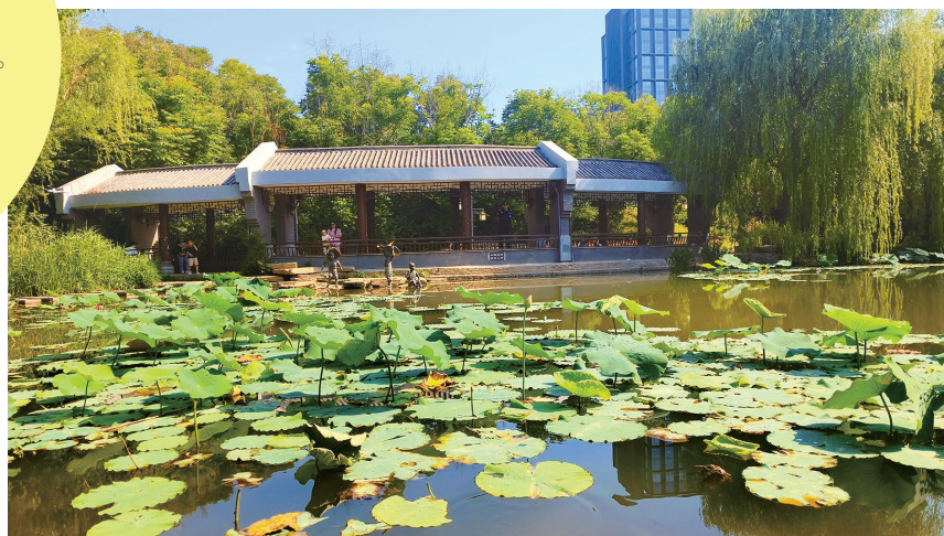
二七区南环公园荷叶池塘美景如画