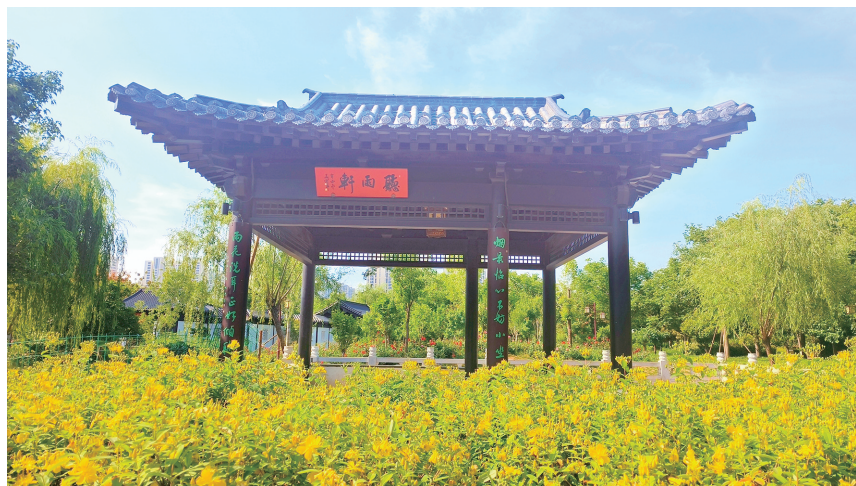
二七区南环公园亭台花海相映成趣