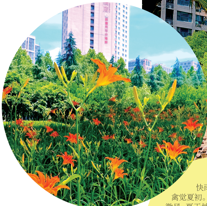
郑西高铁生态廊道(二七段)风景秀丽