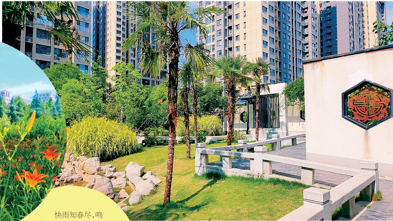
二七区刺绣园高楼环绕绿意盎然

快雨知春尽,鸣禽觉夏初。伴随着和煦的微风,夏天悄然而来。此刻,二七区的公园小径,鲜花绚丽,芬芳扑鼻,树木繁盛,绿草如茵。趁天光正好,温度适宜,出门走走,享受这美好时光。