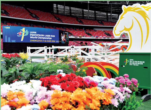
比赛场地被鲜花装点

障碍赛马比赛中，选手和马要配合共同完成12道障碍的跨越，用时少者为胜，只有真正实现“人马合一”的境界，方能成为这个项目中的王者。