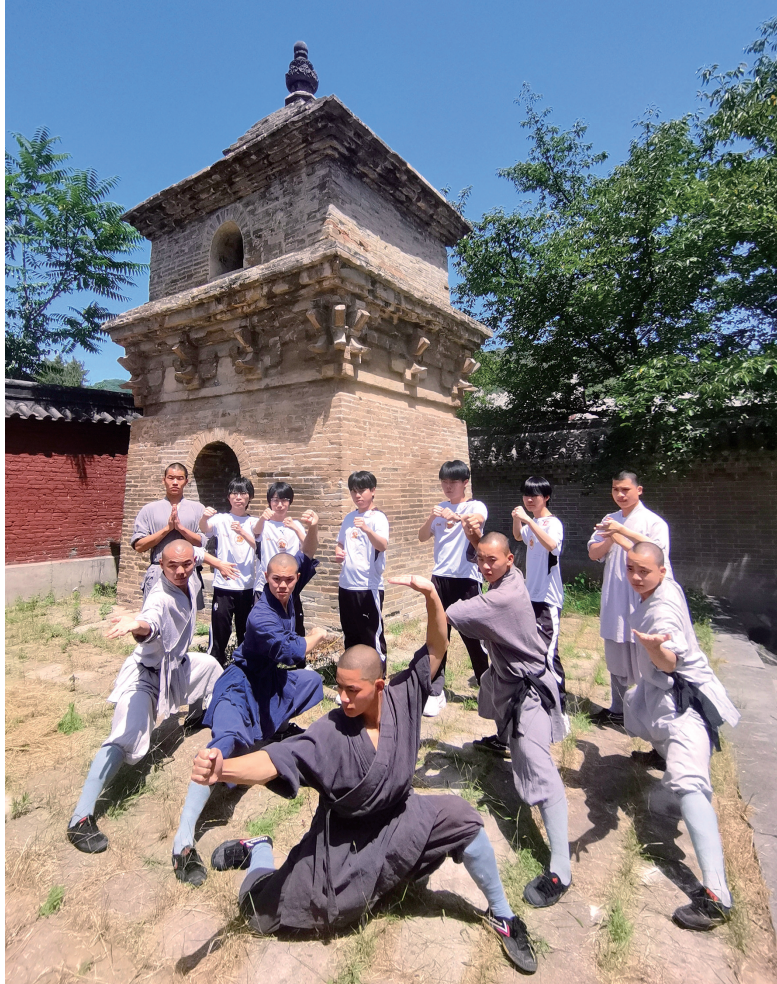
电竞少年向少林武僧学习少林功夫