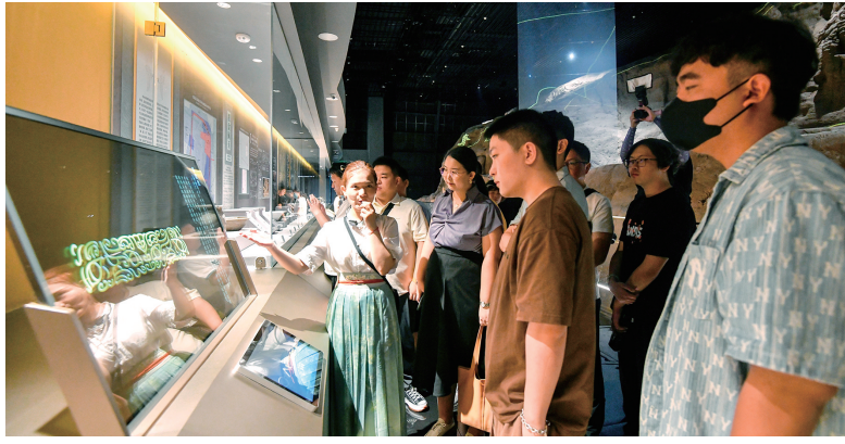
网络大V打卡东城垣遗址博物馆

博近年来正成为中华优秀传统文化的重要展示窗口,成为多元文化沟通交流、交融传承的重要承载平台,成为提升城市文旅声量、推动城市文旅发展的重要呈现场域。 创新与传统齐飞,文化共时代一色。文化离不开“人”的创造,也离不开“场”的滋养。作为微博与郑州合力打造的大型文化IP,2024微博文化之夜系列活动的举办,搭建起的不只是文化盛典舞台,更是一个让外界了解郑州、感知郑州、体验郑州的文化窗口。把握文化的创新传播趋势,在互联网空间内以文化为基链接城市,通过微博强大的互联网场域影响力,促进中华优秀传统文化的创造性转化和创新性发展,让城市形象通过更新颖的渠道得到宣传推广,完成的是文化整合展现,提升的是城市文旅声量,提振的是城市文旅发展,更为区域经济社会发展注入了崭新活力。 横竖撇捺点折钩,多少绝续兴替,岁月深藏;多少传承创新,生生不息。连续两年举办微博文化之夜,见证了微博与郑州在双向奔赴和共同成就中实现了超级文化IP的价值成长与生态繁茂。借力这个多形式、全渠道、高影响力、强延续性大型文化IP的力量,坚定不移走好文旅文创融合发展之路的郑州,必能用不断丰实深化“行走河南·读懂中国”郑州实践的实际行动,将文化动能持续转化为城市发展势能,为推进中国式现代化建设郑州实践作出新的更大贡献。