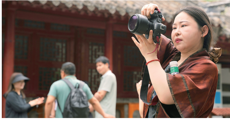
微博博主在登封高阳书院采风