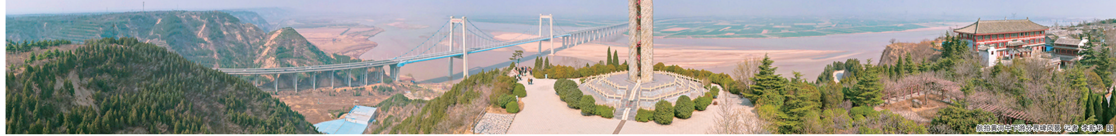
航拍黄河中下游分界碑风景

斗转星移,沧海桑田,奔腾不息的黄河、巍然耸立的嵩山,见证了中国从远古部落到统一的多民族国家。文脉赓续,绵延不绝,融入时代血脉的黄帝文化,持续开掘精神的河床,带人们寻找心灵的原乡。此次讲座主题鲜明、论据详实、论述透彻,深刻解读了中华文明不断裂和强大凝聚力的根源,激发起浓烈的民族情感和家国情怀。 记者 苏瑜