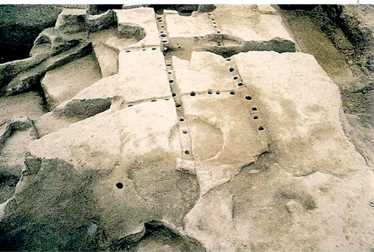
西山遗址建筑遗迹

当前,郑州正在加快建设以“中华儿女的寻根之地、中华文明的朝圣之地、中华文化的体验之地、国学教育的实践之地”为特征的华夏历史文明传承创新基地全国重地,如何更深入地了解黄河文化、嵩山文化,更深刻地理解以黄帝文化为凝聚力的中华民族精神和“中”“和”思想,将有利于更好地塑造“天地之中、黄帝故里、功夫郑州”城市品牌,持续推动中华优秀传统文化创造性转化、创新性发展,为郑州国家中心城市现代化建