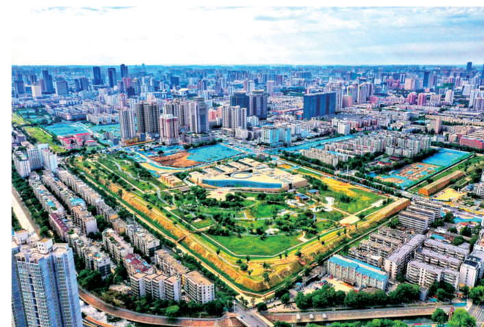
郑州商城遗址航拍图