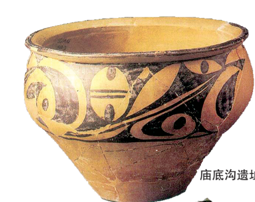
庙底沟遗址出土的仰韶文化彩陶器

近日,2024年第二期全市领导干部“问学前沿”高端讲堂举行,中国社会科学院学部委员、郑州大学考古与文化遗产学院特聘院长刘庆柱以《嵩山文化:中华文明突出特性》为题作专题辅导,阐述了嵩山文化、黄河文化的重要地位与作用,对郑州讲好中华文明连续性的故事提出了意见建议。