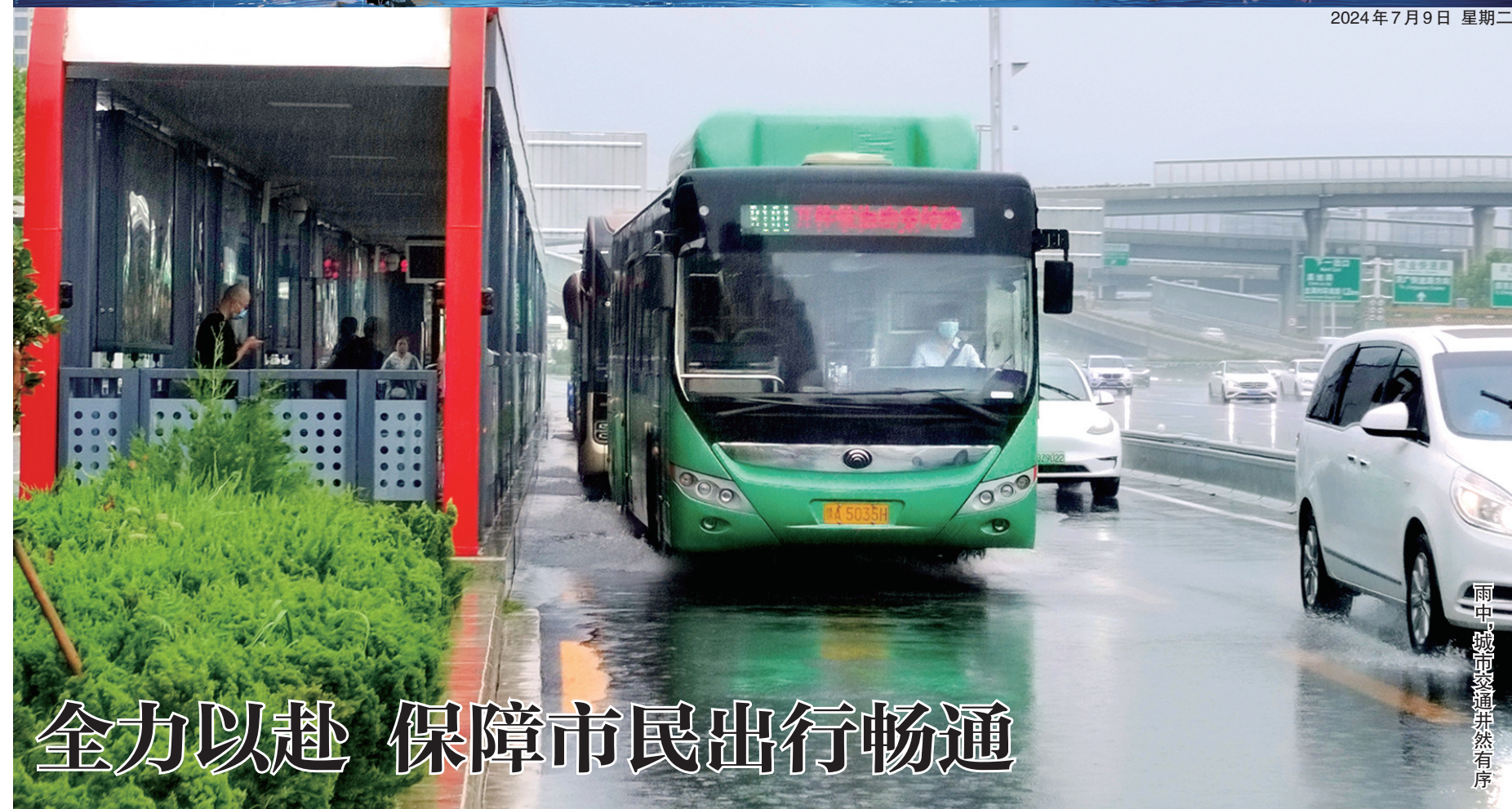
雨中，城市交通井然有序