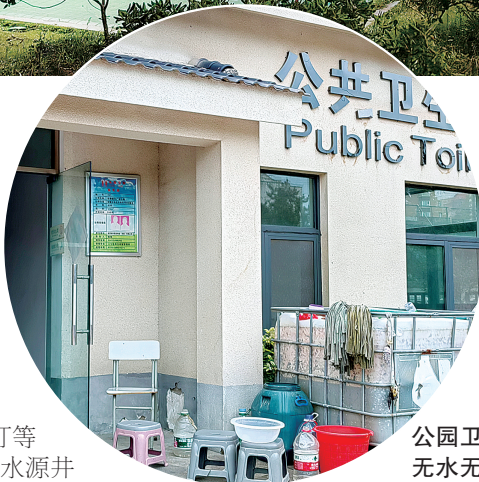
公园卫生间 无水无电

是下穿还是上架线路,都需要与铁路部门沟通。”工作人员希望上级部门帮助处理水电难题。