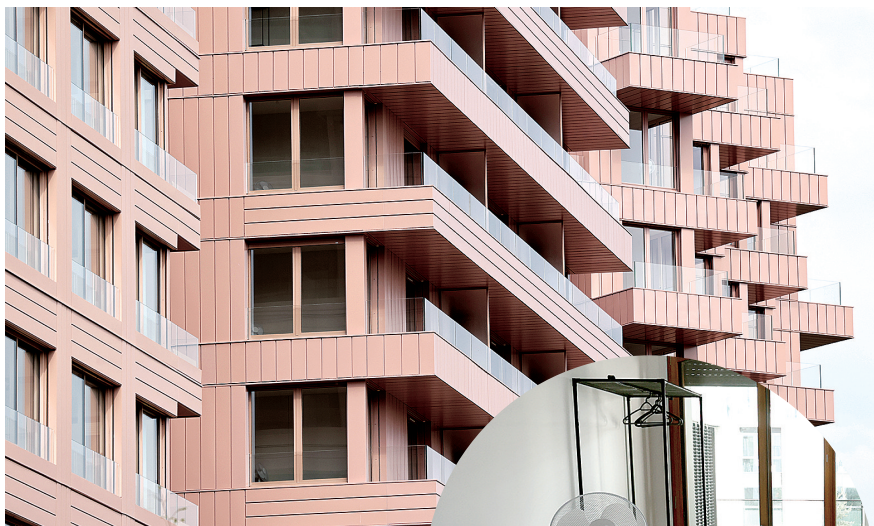
巴黎奥运村和残奥村建筑外景

在这样一个全球瞩目的盛事当中,用“极限环保”来应对可能出现的极端天气,巴黎这一次赌得够大的。