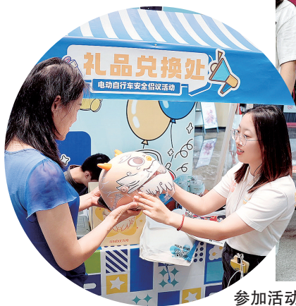
参加活动的市民领取精美礼品

据不完全统计,目前郑州两轮电动车保有量已突破400万辆,平均每三人就拥有一辆。但同时,由非法改装、不合理充电、不遵守交通规则等引发的安全事故也在