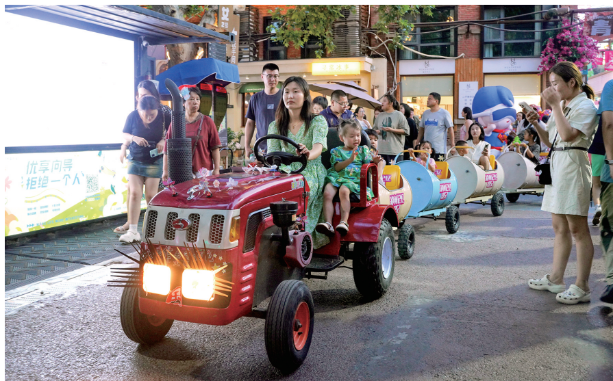
郑州记忆·油化厂创意园的夏夜

每逢周末,夜幕降临,夏风习习,郑州记忆·油化厂创意园逐渐热闹起来,夜场音乐响起熟悉或不熟悉的摇滚和民谣,空气里飘荡着烤肉和火锅的诱惑,灯光摇曳里晃动着欢乐的人影,这是你最喜欢看到的夜郑州吗?