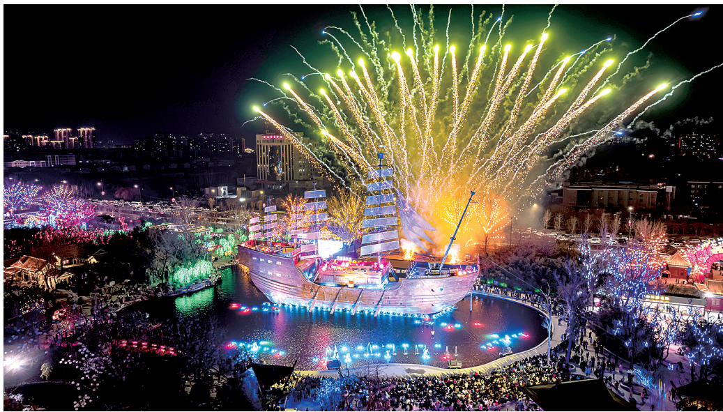
万岁山武侠城实景演出《神舟传奇》

本报讯(开封日报记者田宏杰)在开封市老城区北部,有一座国家4A级旅游景区,近几年成为省内外游客竞相打卡的热门景区。它就是以武侠文化为旅游特色的大型游览区——开封万岁山武侠城。