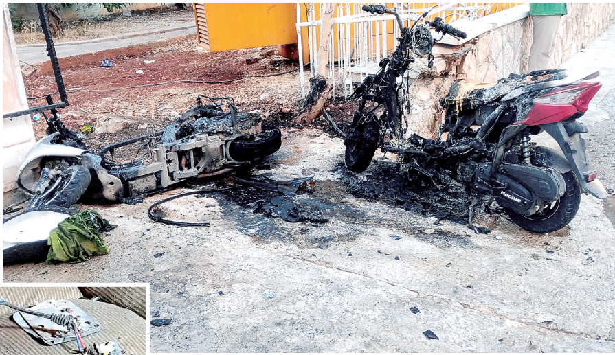
上图:通信设备爆炸损毁的摩托车 左图:爆炸后损毁的通信设备

以色列官方至今没有回应。一名不愿公开姓名的美国官员披露,以方17日提前告知美方,以色列将在黎巴嫩“干点事情”。