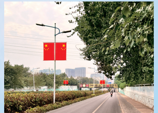
瑞达路上红旗招展