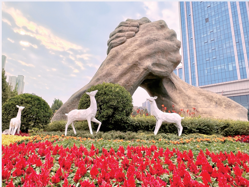
高新区国旗广场盛装迎国庆