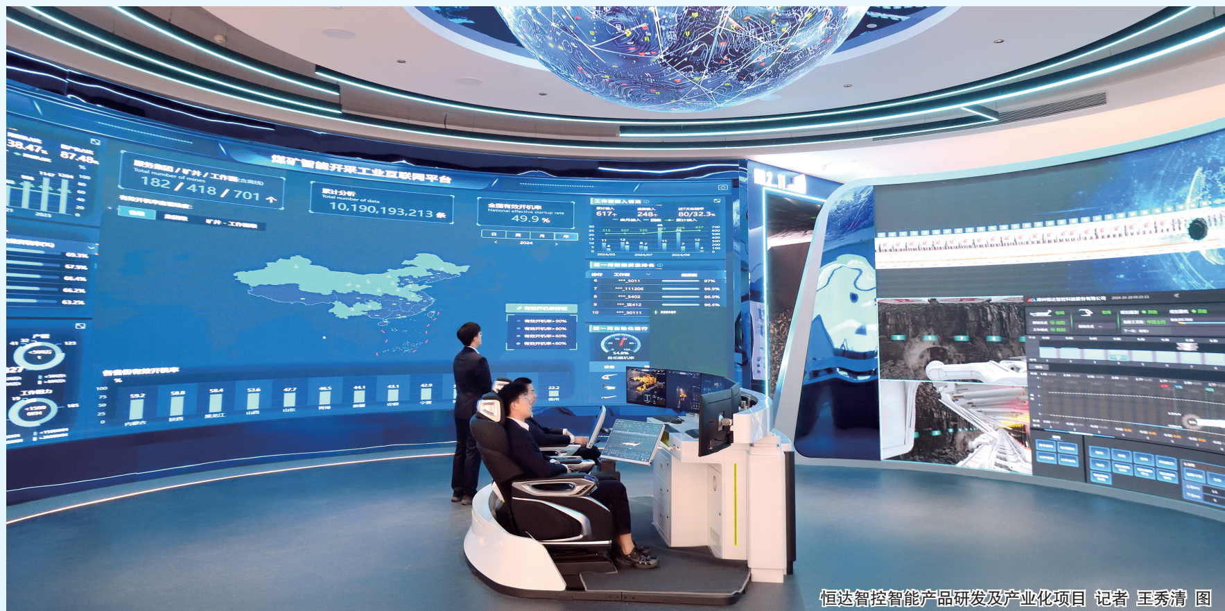
恒达智控智能产品研发及产业化项目

锚定目标不放松,年终冲刺是关键。经济大市要勇挑大梁,这是责任,更是使命。距离年底只有两个多月时间,时间紧、任务重。全市上下要立足郑州在全局中的定位和使命,紧盯时间窗口和时间节点,抢抓政策机遇、保持战略定力、坚定发展信心,千字当头、众志成城,以“人一之,我十之”的昂扬斗志和拼抢劲头,全力奋战四季度,奋力开创高质量发展新局面,用实实在在的高质量发展成效确保全年目标任务圆满完成,为推动全国全省经济持续回升向好做出更大积极贡献。