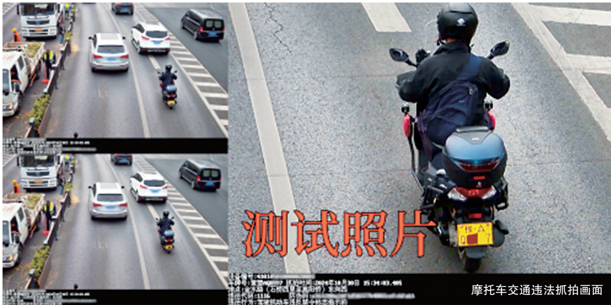
摩托车交通违法抓拍画面

本报讯(记者 张玉东 通讯员 邢红军 文/图)为加强郑州城区道路交通安全管理,预防和减少道路交通事故,根据法律法规规定,郑州公安交管部门在城区金水路增设6处交通技术监控设备,从11月10日开始投入使用,主要查处摩托车违反禁令标志指示等交通违法行为。